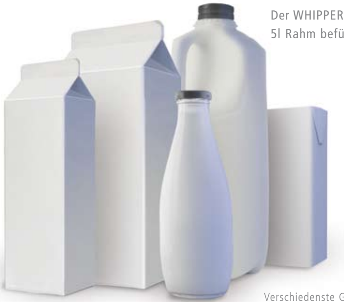
Verschiedenste Gebinde lassen sich direkt in das Gerät stellen.

Der WHIPPER 5 lässt sich mit 5l Rahm befüllen.